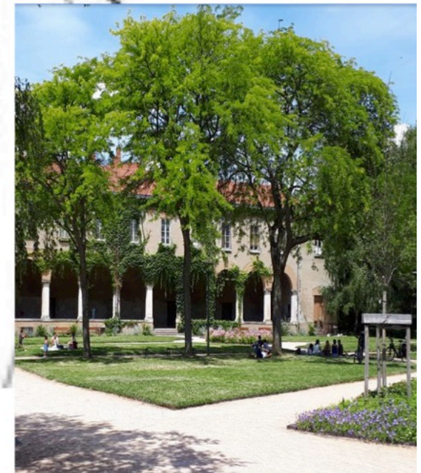
Exemple d'allée piétonne au Parc de la Visitation (Lyon 5)