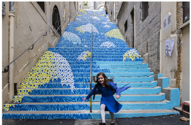
L'escalier Mermet - Lyon 1