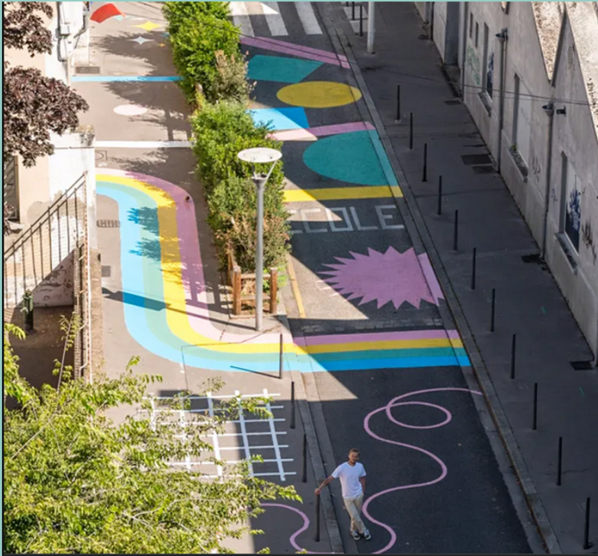
L'école Meynis - Lyon 3 Par l'artiste Tomalater