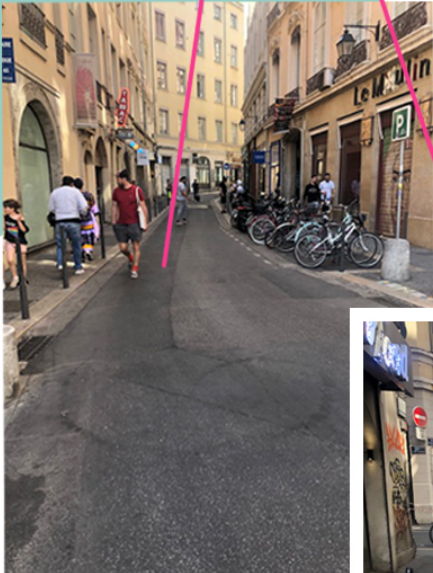
Rue Romarin : Section entre Terreaux et Sainte Catherine