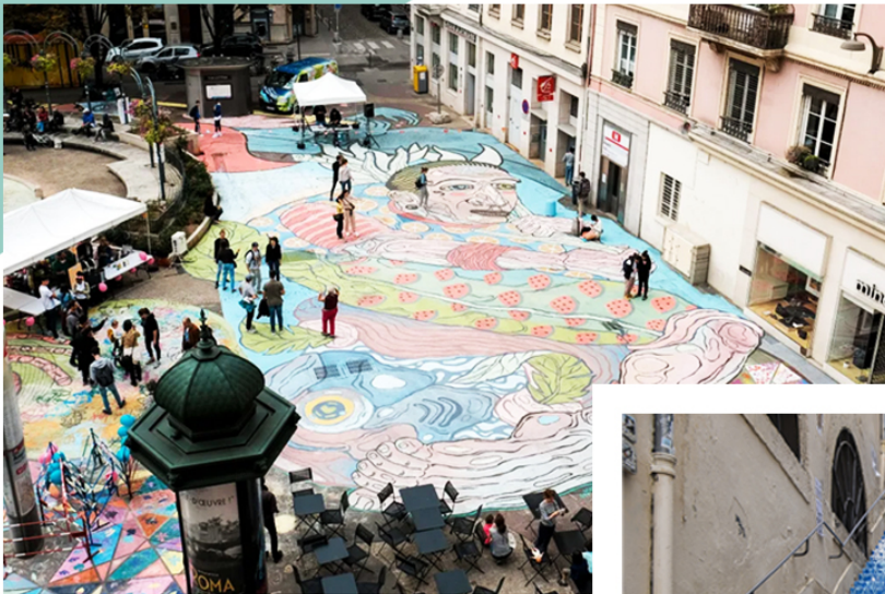
Rue Victor Hugo - Lyon 2